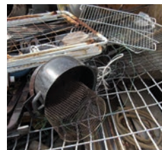
Ferraille de déchetterie