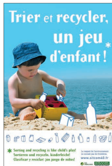
Campagne d'affichage en quatre langues réalisée auprès des campings, résidences de vacances et offices de tourisme.

Pour faire face à cette production supplémentaire de déchets, et afin de maintenir un service de qualité, le SITCOM augmente les fréquences de collecte sur l'ensemble des communes côtières, que ce soit pour la collecte des ordures ménagères ou des emballages. Pour cela, le SITCOM recrute 75 saisonniers qui viennent en renfort des équipes existantes pendant les mois de juillet et d'août.