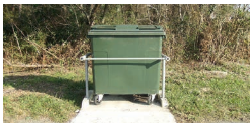
Conteneur à ordures ménagères