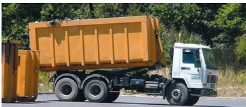
Transport des déchets