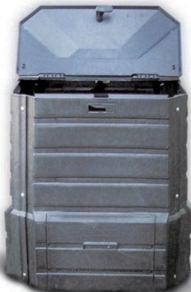
Composteur mis à disposition par le SITCOM

Le compostage en bac est plus pratique à l'usage. Alors à vous de choisir !