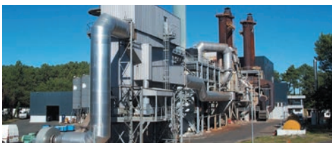
Usine de Bénesse-Mareme