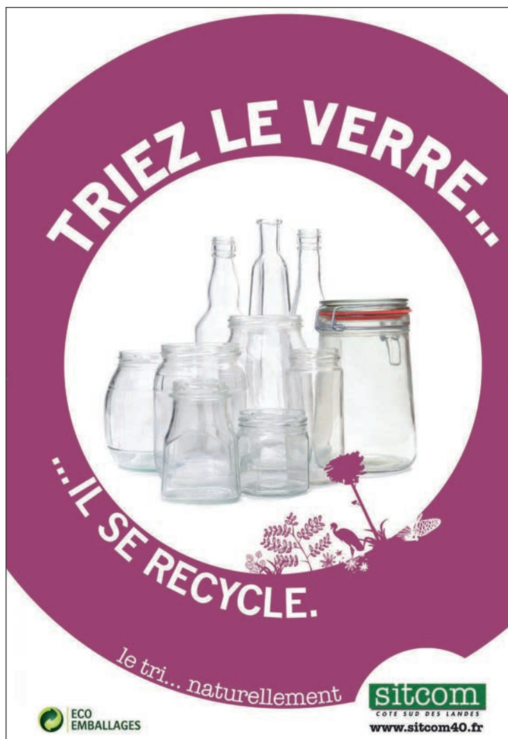
Affiche diffusée sur l'ensemble des points tri

6 000 tonnes de verre sont collectées annuellement au SITCOM, soit l'équivalent de 20 millions de bouteilles !