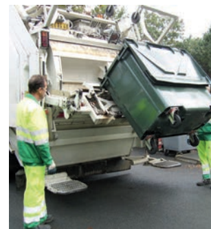
Collecte des ordures ménagères

Créé par plusieurs communes du littoral landais, le SITCOM a progressivement étendu sa zone d'action et intéresse aujourd'hui 76 communes.