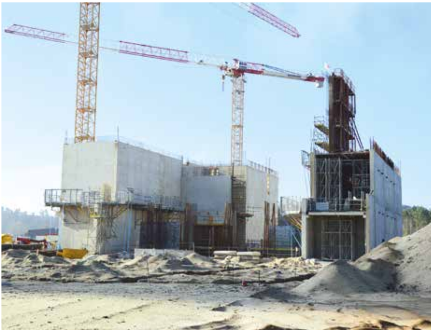
UVE, vue depuis la route de Capbreton

À la fin du mois de janvier, les fondations étaient quasiment terminées (bâtiments, fosse, traitement des fumées, ...).