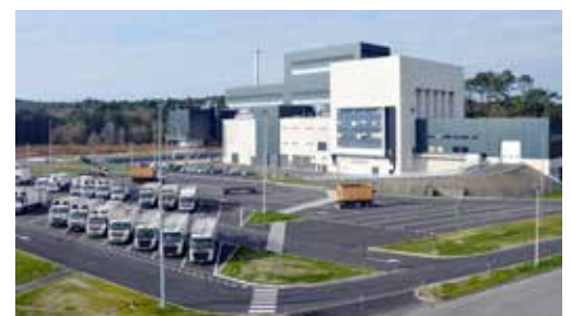
L'Unité de Valorisation Energétique de Bénèsse

L'UVE répond aux MTD, Meilleures Techniques Disponibles. Ces dernières sont celles présentant le meilleur compromis écologique et économique pour l'environnement. La technique choisie permet d'avoir une bonne performance énergétique car ici, il s'agit de traiter de mieux en mieux...et non de plus en plus ! L'UVE de Bénèsse Maremne transforme ainsi toute l'énergie en électricité. L'énergie globale annuelle distribuée sur le réseau public d'électricité est de 50 000 MWh, sans compter l'énergie autoconsommée par l'usine pour ses propres besoins. Cette énergie correspond à la consommation annuelle d'une commune de 30 000 habitants.